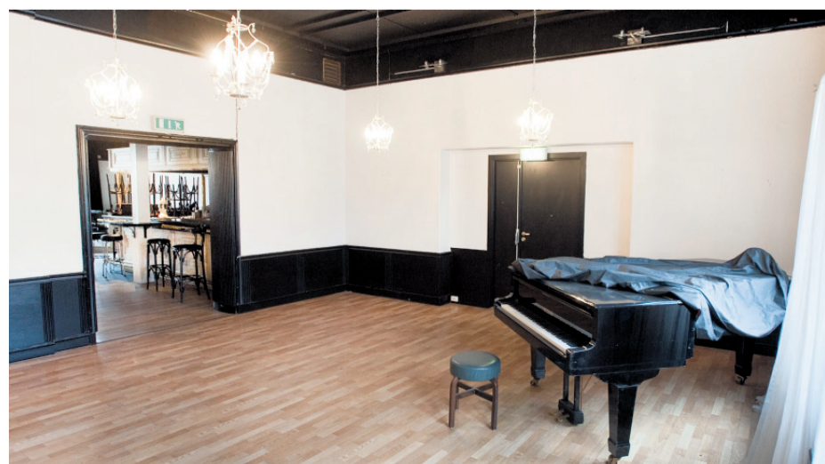
I naborommet til tidligere Bien står et ensomt flygel. Det er ikke noe musikk å høre her lenger...