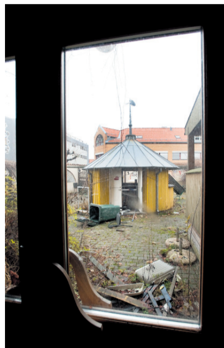
Det er et sørgelig syn å titte fra Arbeidersamfundet og ut i Biehagen.