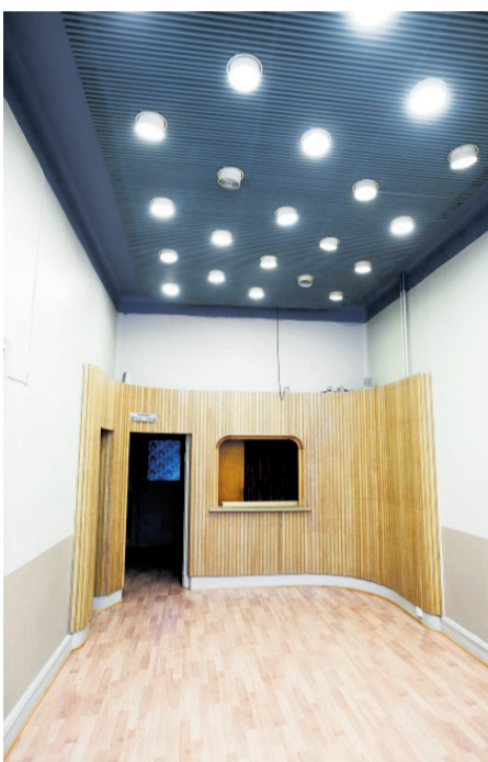
Taket lyser flott og pent i gangen. «Billett kiosken» står der fremdeles.