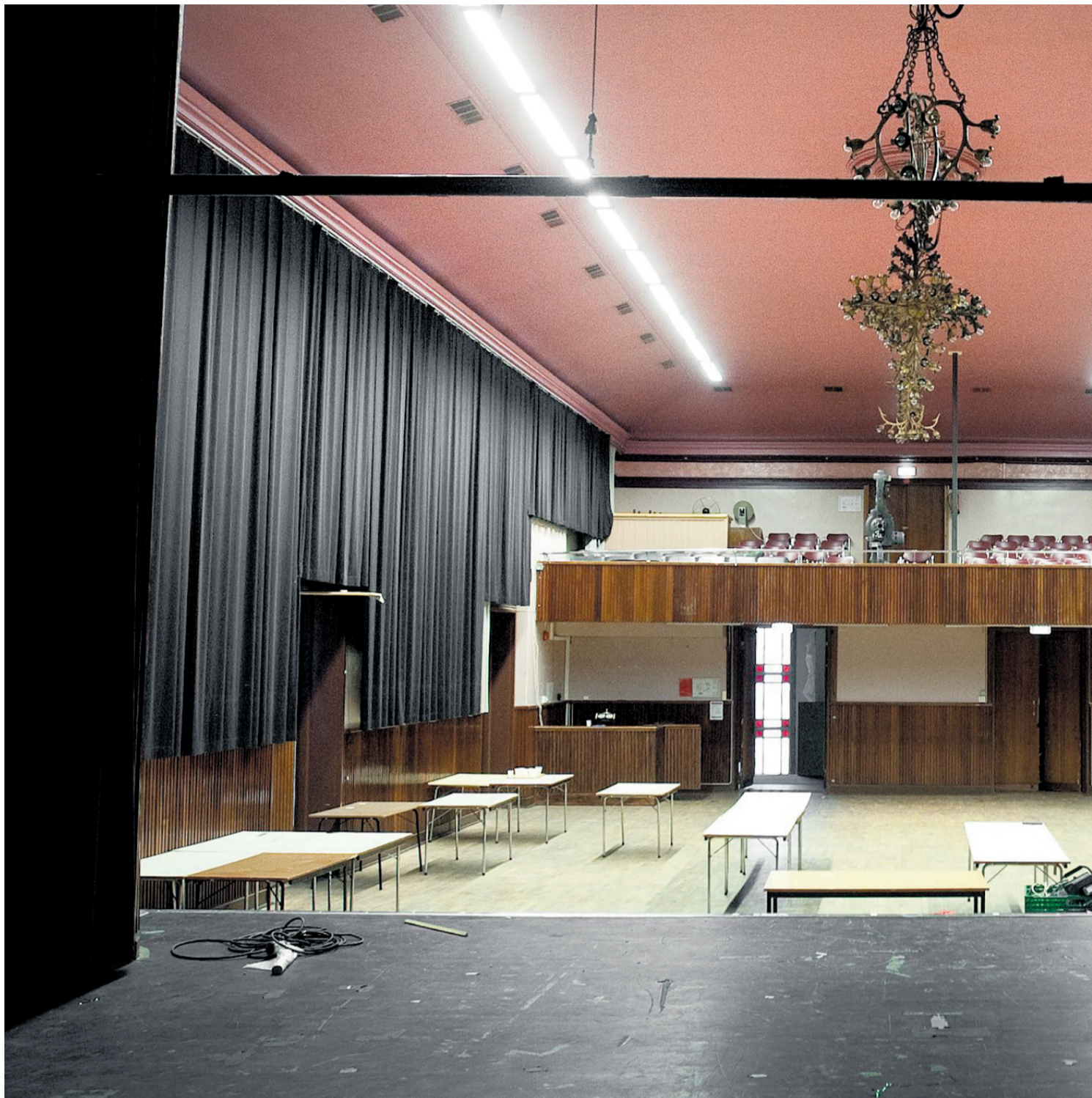
Arbeidersamfundet flyttet inn i eget bygg i 1891. Storsalen, og bygningen, ble restaurert 1947–1949. Den store salen har samme utseende som Ballroom i San Francisco i november 1976, og foreviget i regissør Martin Scorseses berømte film. Noe tilsvarende, selv i mindre målestokk.