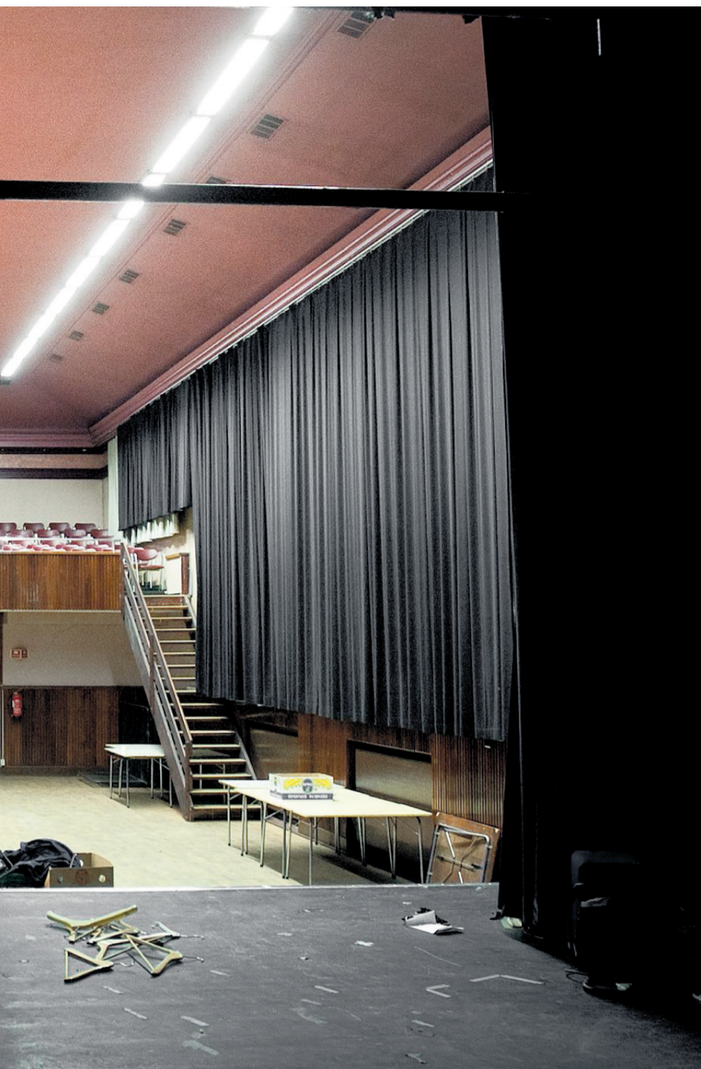
63 år senere. Den minner om The Bands avskjedskonert «The Last Waltz» på Winterland i San Francisco. I 1949 hadde Arbeidersamfundet og Halden fortjent.