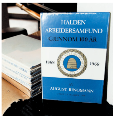
Boka har blått omslag.

På et bilde i boka ses koret og samfunnsmedlemmer samlet til prosesjon 17. mai 1908. Koristene var frontet av hornsekstetten Heimdal.